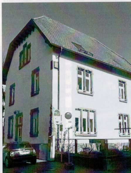
Nähschule und Schwesternhaus der Vincentinerinnen in der Schulstraße.

verein Waldkirch und geben dem Verein eine Satzung. Diese wird von acht Gründungsmitgliedern unterzeichnet und dem Vereinsregister beim Amtsgericht Waldkirch zur Eintragung vorgelegt.