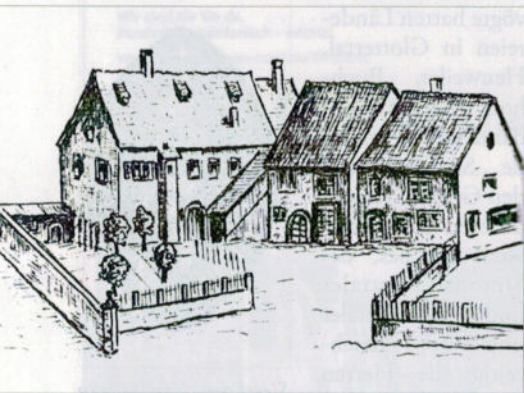
St. Nikolausspital, Hofseite. Federzeichnung des Verfassers nach einer Bleistiftskizze im Tagebuch des Orgelfabrikanten Franz Bruder I.

1826 werden die Vermögen des St. Nikolauspitals, des St. Nikolai-Spitalsfonds, des Leprosenfonds, der in Oberkollnau ein Leprosenhaus betrieben hat, und des Probst-Birsner-Fonds, den der Stifts-Probst Birsner gestiftet hat, zu einem Distriktsfonds zusammengefasst. Das Armenspital in Waldkirch wird zu einem Kranken- und Armenspital für die 17 zugehörigen Ge-