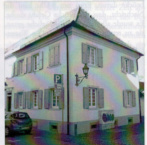
Caritassekretariat in der Kaplanei Kirchplatz 1.

gaben der Allgemeinen Armenfürsorge für bedürftige Bürger und deren Familien und für benachteiligte Menschen, individuelle Unterstützungen in verschiedensten Not-