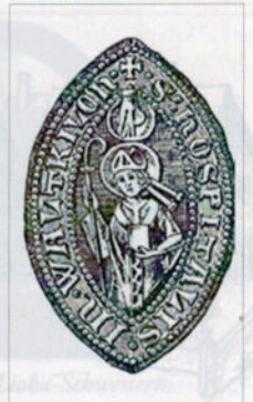
Siegel des „Hospitalis in Wältkilch“ (1359).

Die Frauen des Margarethenklosters erfüllten diesen Auftrag mit dem Spital, das vor den Toren der Stadt Waldkirch erstellt und dem heiligen Nikolaus gewidmet wurde. Schutzbögte für das Margarethenkloster waren die Herren der Schwarzenburg und der Kastelburg. Das Margarethenkloster und deren Schutzbögte hatten Ländereien in Glottertal, Heuweiler, Buchholz, Suggental, der damaligen Gemeinde Stahlhof und den Gemeinden des unteren und mittleren Elztales, des Simonswaldertales und der Seitentäler und waren gleichzeitig die Herren von Waldkirch.