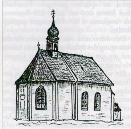
St. Nikolausspitalkirche. Federzeichnung nach Aufzeichnungen des Landesvermessungsamtes vom 05.04.1826 mit dort vermerkten Korrekturen. Original im Landesvermessungsamt Baden-Württemberg.

1178 wird erstmals eine Spitalkirche St. Nikolaus bei Waldkirch erwähnt.