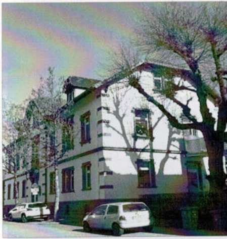
Das heutige Kindergartengebäude in der Schulstraße.