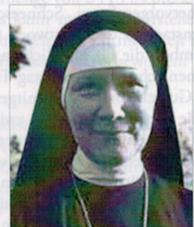
Ordenstracht der Lioba-Schwestern.