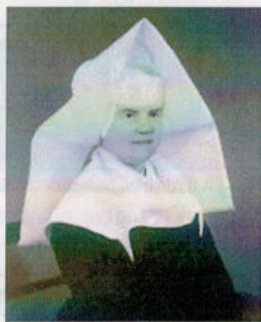
Tracht einer Vinzentinerin.

anzustellen und zu entlassen. Die Oberin hatte die Hausschlüssel zum Spital, um bei beginnender Nacht die Pforten zu schließen und sie bei Tagesanbruch wieder zu öffnen.